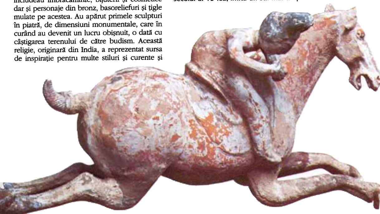
● O sculptură ceramică a unui jucător de polo călare, aparținând dinastiei T'ang. Mișcarea și vitalitatea emanată de această lucrare, strălucitor colorată, sunt caracteristice artei T'ang.