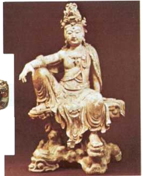
▲ O sculptură din lemn, din secolul al 13-lea, reprezentându-l pe Kuan-Yin, un zeu budist din China. El este în poziția maharajalia, ceea ce ar însemna "tihnă regală". Pe cap poartă o podoabă care îl reprezintă pe Amitabha Buddha. Se mai pot observa pe sculptură urme ale picturii inițiale.