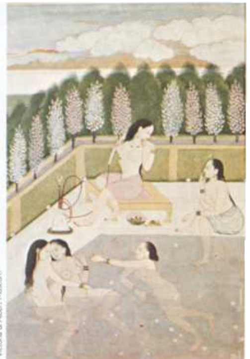
⚠ Eleganța femeilor din acest tablou din secolul al 18-lea este o trăsătură principală a picturii Pahari, ultima dintre artele hinduse înfloritoare, înainte de influența europeană.