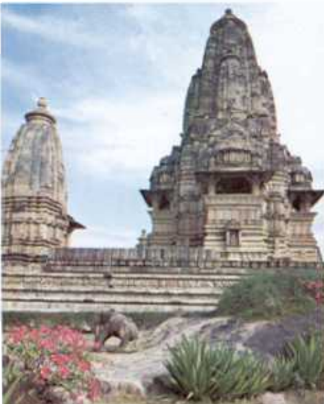
⚠ Templul Lakshmana din Khajuraho a fost construit aproximativ în secolul al zecelea d.Hr. Turlele curbate sunt caracteristice stilului artistic Nagara, fondat în nordul Indiei.

Arta miniaturilor a fost introdusă din Persia tot de către moguli. "Miniaturile" nu sunt neapărat mici: termenul descrie pur și simplu anumite ilustrații pictate, de orice dimensiune. Pentru crearea acestora, împăratul Akbar a angajat artiști – mare parte hinduși – din întreaga Indie. În atelierile acestora a luat naștere un nou stil, mai viguros și mult mai descriptiv