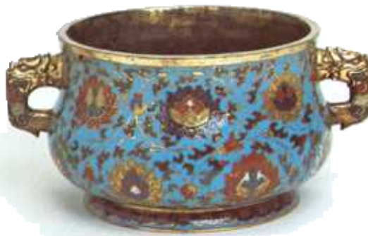
▲ Vas din metal, emailat, pentru ars esențe parfumate, aparținând dinastiei Ming, din secolul al 15-lea, imită un stil mai timpuriu.

Dezvoltarea Japoniei a fost determinată de faptul că ea a fost izolată de marile civilizații, cu excepția Chinei. Încă din secolele cinci și șase, când ideile despre guvernare, literatură, diferitele ramuri ale artei și religia budistă au