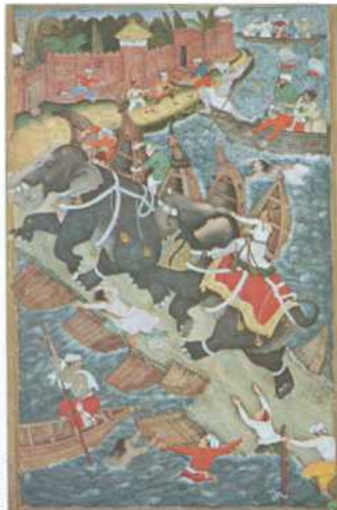
⚠ O miniatură din Akbar-Nama, biografia împăratului mogul Akbar, din secolul al 16-lea, în care este reprezentat călărind un elefant de-a lungul unui pod susținut de bărci.

În perioada ce a durat cam 500 de ani, chinezii au creat vase robuste din bronz, cu un aspect aproape sinistru, concepute pentru a aduce ofrande strămoșilor. Aceste vase sunt intens decorate cu simboluri care par a fi abstracte dar sunt de fapt reprezentări foarte simplificate și stilizate ale creaturilor mitice,