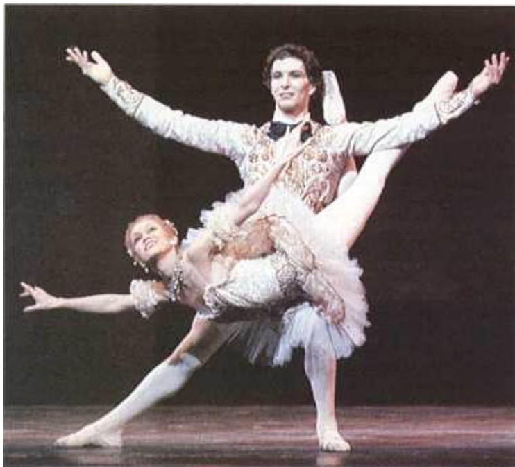
Daryl Williams/The Dance Library

Ghiaghilev a murit în 1929, iar grupul său pînă la urmă s-a destrămat, dar un membru care a