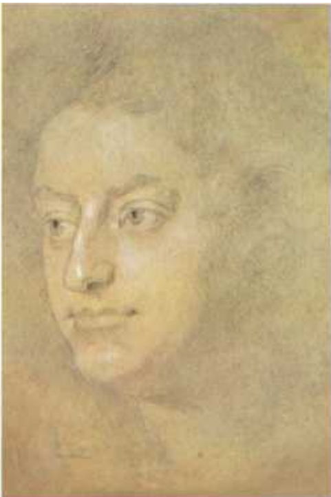
National Portrait Gallery

O scenă din Il Pomo d'Oro , realizată în 1667. O producție spectaculoasă ce implica schimbarea a 24 de decoruri în 4 acte și care necesita un număr foarte mare de actori.