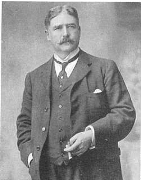
Mander & Mitchenson

⦿ Omul de teatru englez George Edwardes a fost primul care a creat, în 1890, genul pe care l-a numit "comedie muzicală". Spectacolele sale vesele, rupte de realitate, au devenit repede populare pe ambele maluri ale Atlanticului.