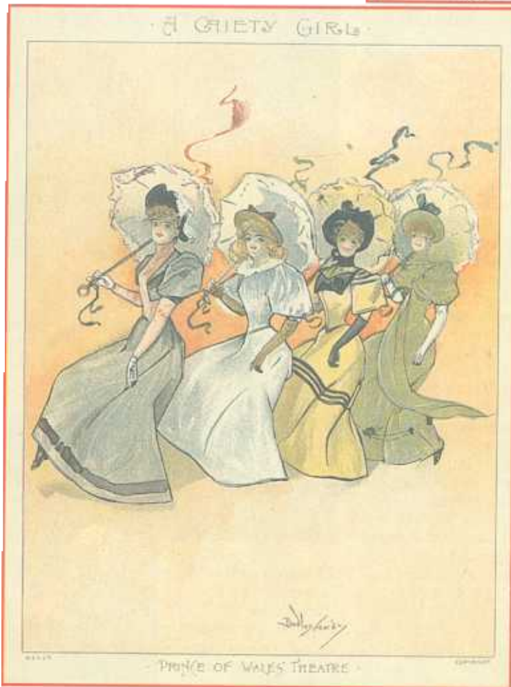
Mander & Mitchenson

prescăresc din New England, iar South Pacific era o poveste din cel de-al doilea război mondial, petrecută pe o insulă polineziană. Cu toate acestea, exista o denaturare de alt gen în modul de tratare al spectacolului, care includea elemente fantastice dar și macabre, chiar momente de tragedie; un exemplu relevant în acest sens constituindu-l Carousel -ul, în care personajul principal este ucis în timp ce încerca să jefuiască și căruia, mai apoi, i se acordă șansa de a mai îndeplini un ultim act de bunătate pe pământ, el reușind prin acesta să-și răscumpere viața.