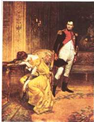
A SOUVENIR OF "A ROYAL DIVORCE" With the Compliments of W. W. KELLY

O selecție a programelor melodramelor din secolul al XIX-lea. Titlurile lor, cum ar fi Un bărbat diversionist sau Onoarea unui soldat , fac o trimitere directă la temele pline de sentimentalism și senzație, apreciate de public.