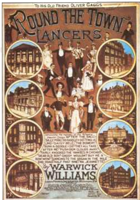
Marsden &amp; Michelson Theatre Collection

● Coperta unei partituri cu cântecele celebre ale teatrele de revistă din secolul al XIX-lea. Odată cu creșterea succesului teatrele de revistă s-au mutat din taverne în clădiri destinate acestui scop. În perioada de glorie clădirile teatrele de revistă erau imense și bogat decorate.