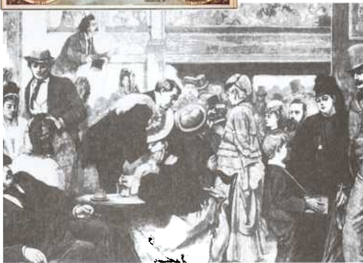
Marsden &amp; Michelson Theatre Collection

▼ Teatrul de revistă Mogul, din Londra, construit de J D Linton (1873). Teatrele de revistă erau iubite pentru atmosfera relaxantă și pentru spectacolele oferite.