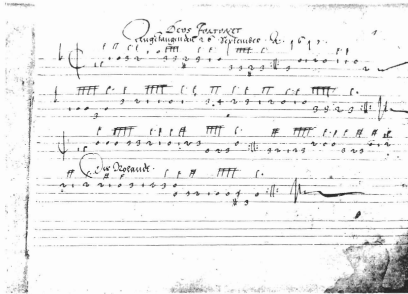
Italienische Violinentabulatur von 1613. Nürnberg, Germanisches Museum Ms. 14976.