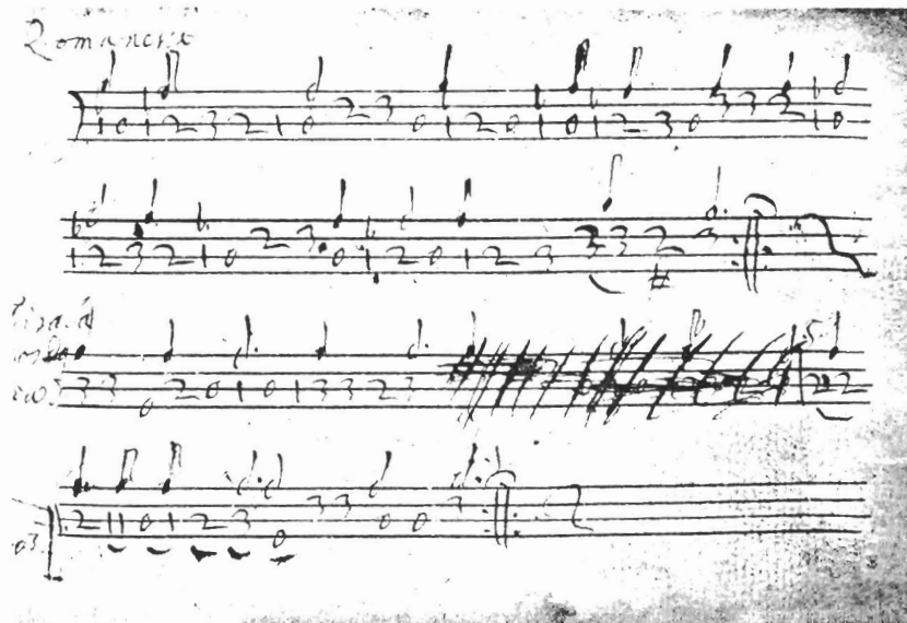
Italienische Violinentabulatur des 17. Jahrhunderts. Nürnberg, Germanisches Museum Ms. 33748